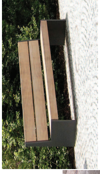
Robuste Ausstattung mit Holz