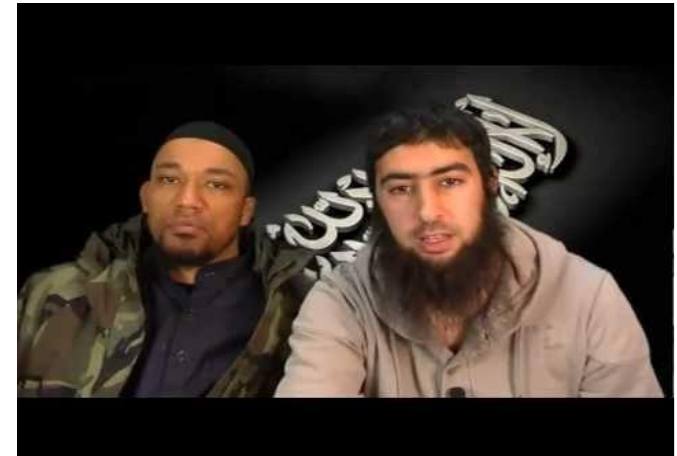
Denis Cuspert (Abu Malik) & Said el-Emrani (Abu Dujana)