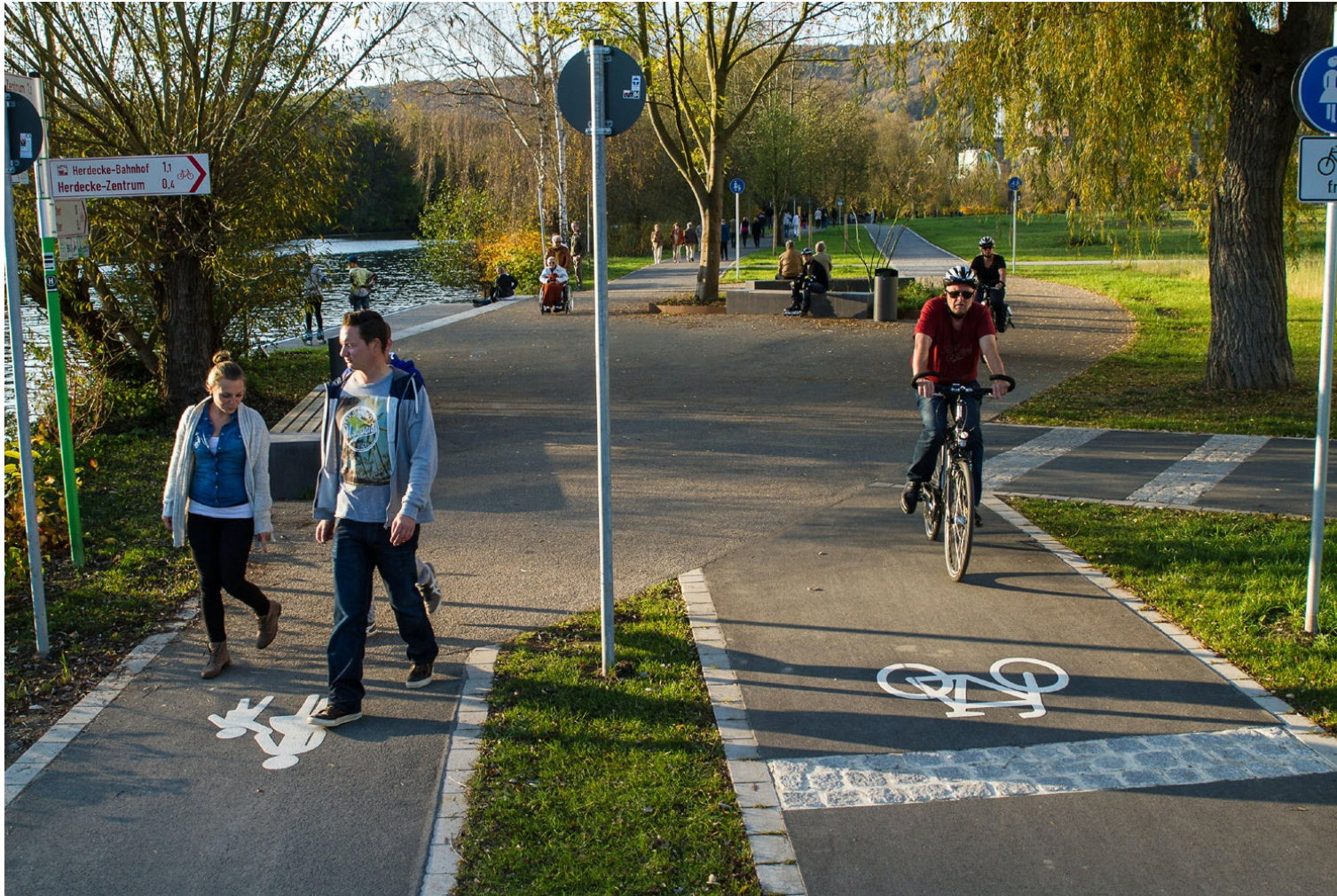
Geh- und Radwegeverbindung Ruhraue / Herdecke