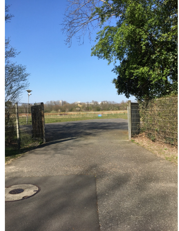
Möglicher Eingang Rennbahngelände