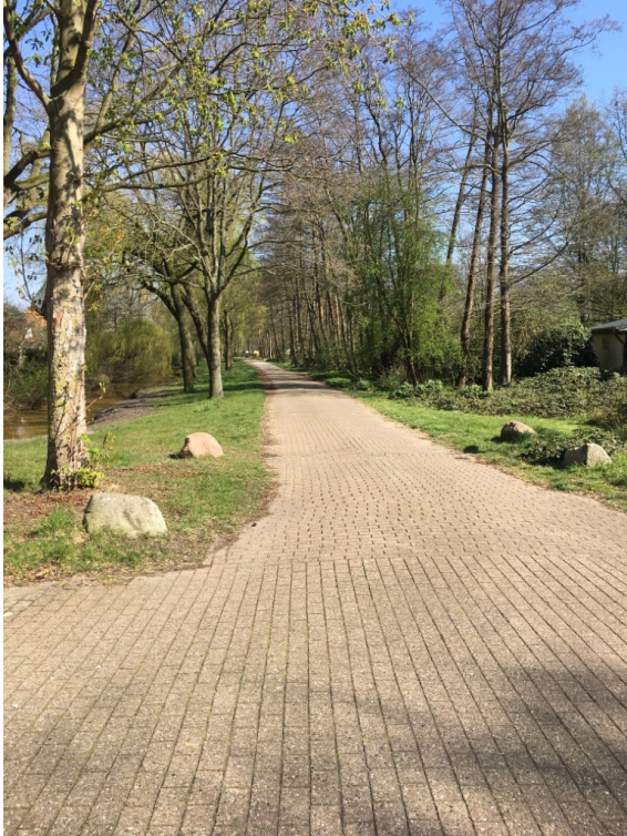
Champignonweg Kleingartenanlagen Im Holterfeld