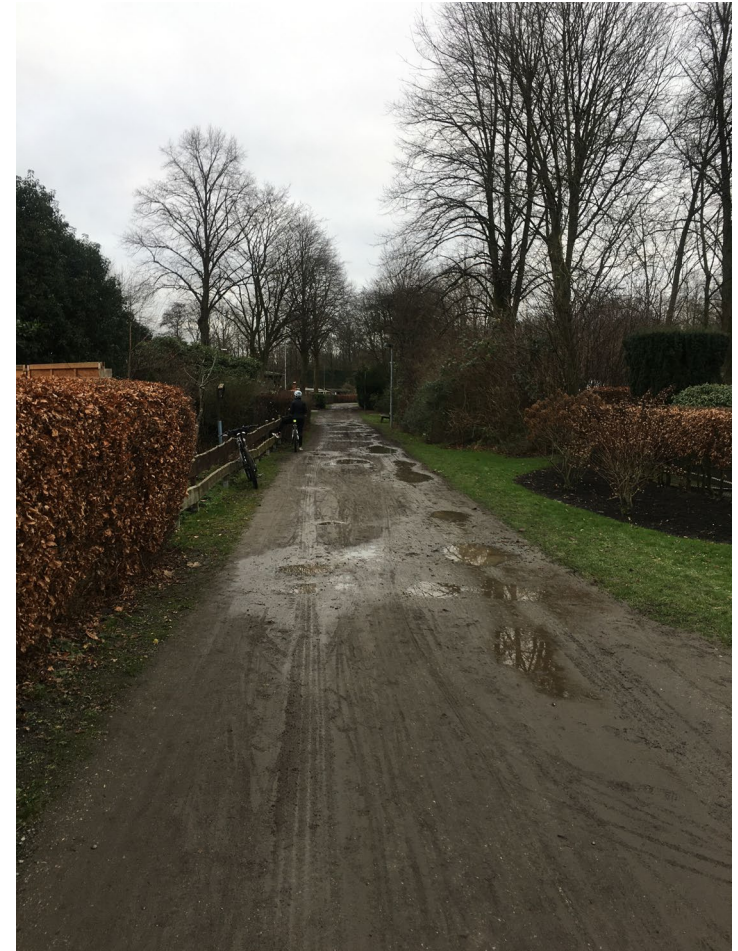
Vroniweg, Kleingartenanlage Vahr