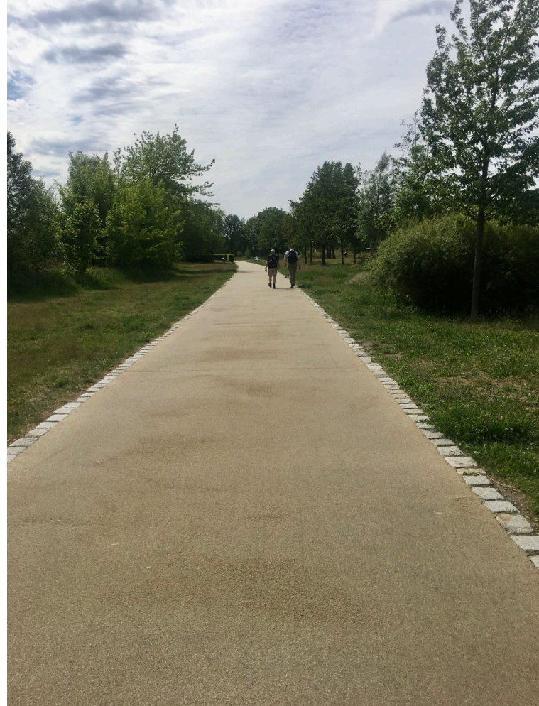
Geh- und Radwegeverbindung Berlin-Spandau