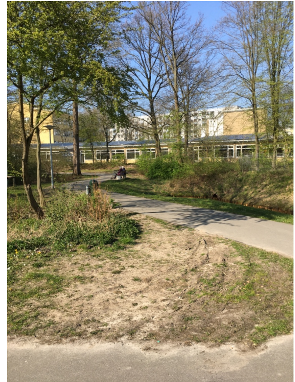
mögliche Anbindung Carl-Gordeler-Park