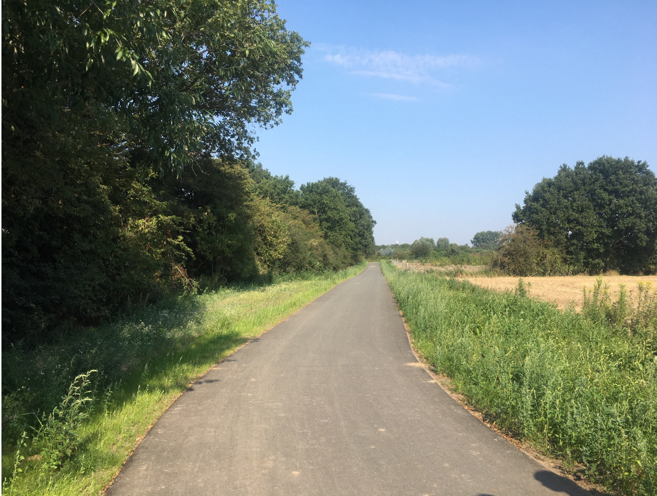
Geh- und Radwegeverbindung Bremen-Hemelingen / Arbergen