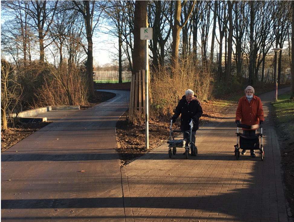
Neue Wegeverbindung Blockdieksee, Osterholz