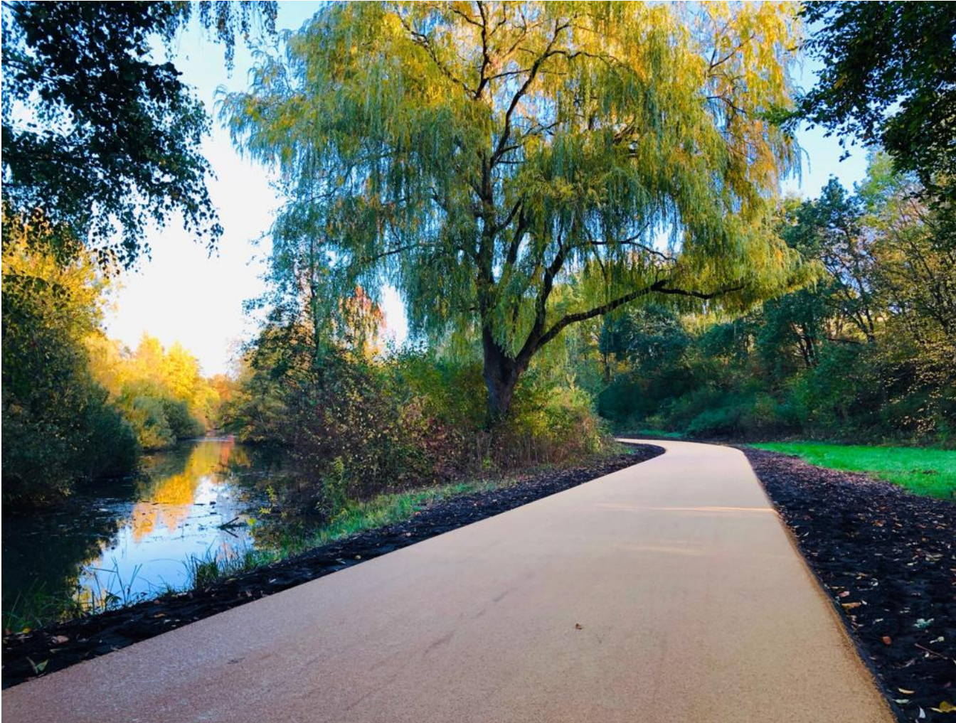
Geh- und Radwegeverbindung Ludwig-Roselius-Allee / Bremen-Hemelingen