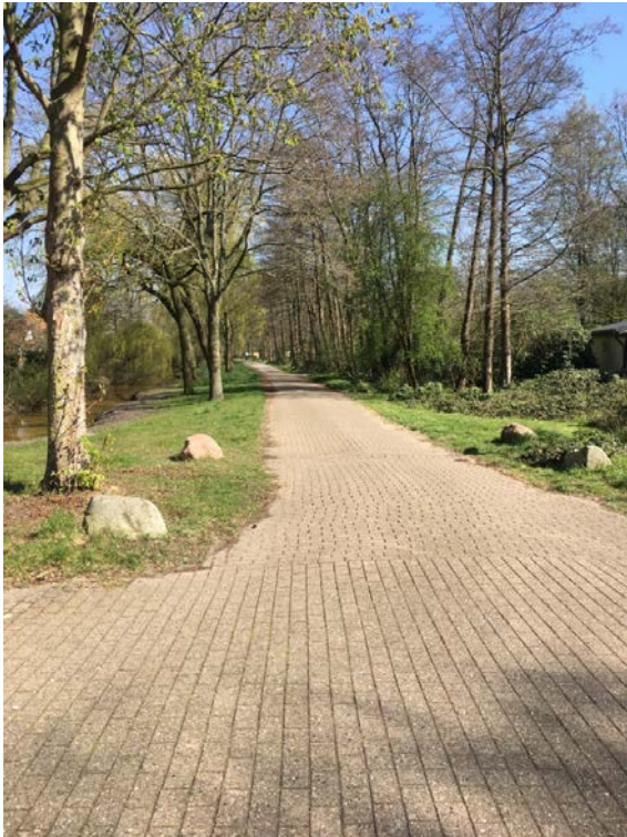
Champignonweg Kleingartenanlagen Im Holterfeld