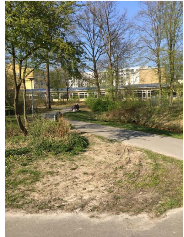
mögliche Anbindung Carl-Gordeler-Park