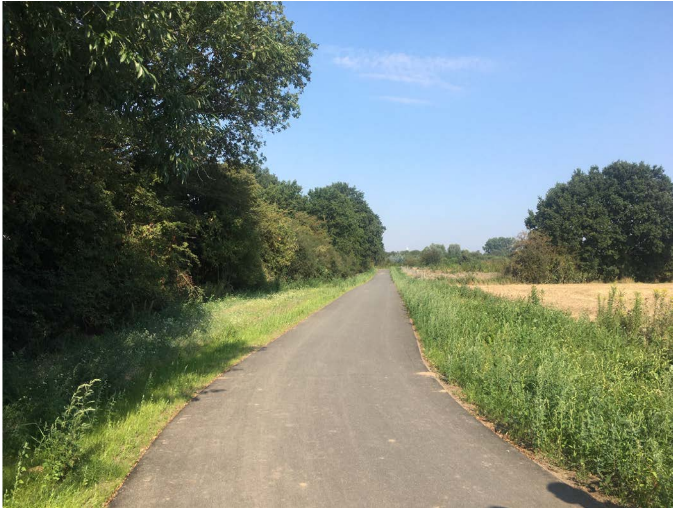
Geh- und Radwegeverbindung Bremen-Hemelingen / Arbergen