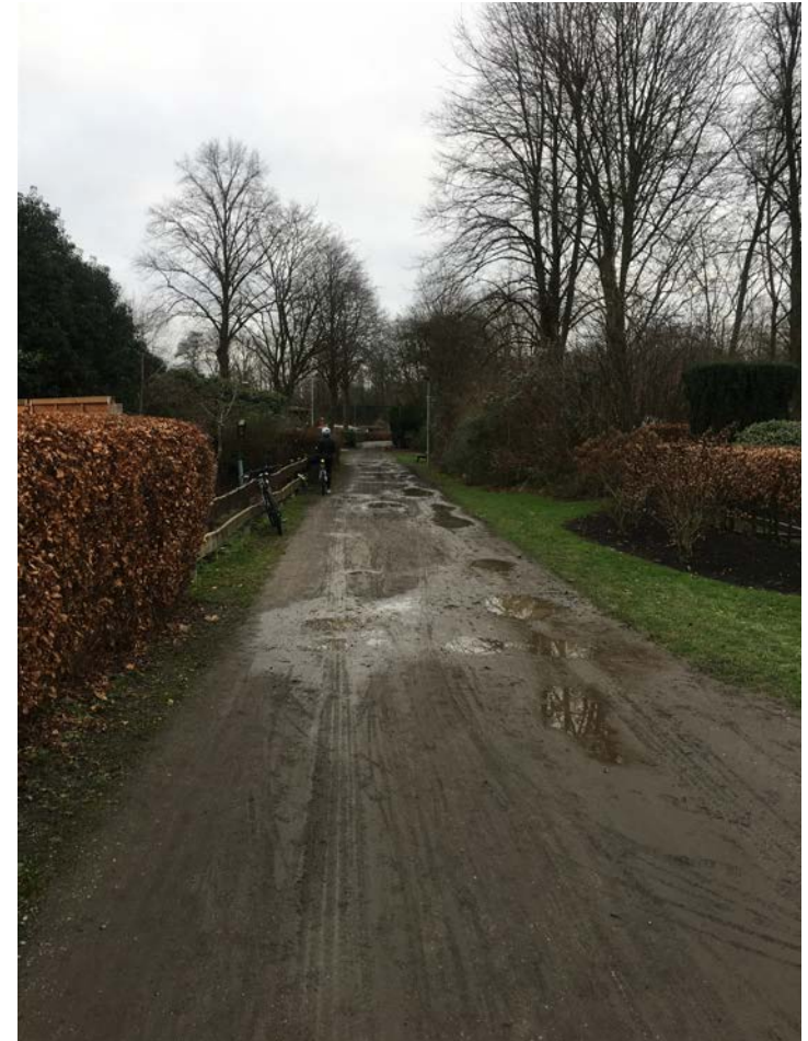
Vroniweg, Kleingartenanlage Vahr