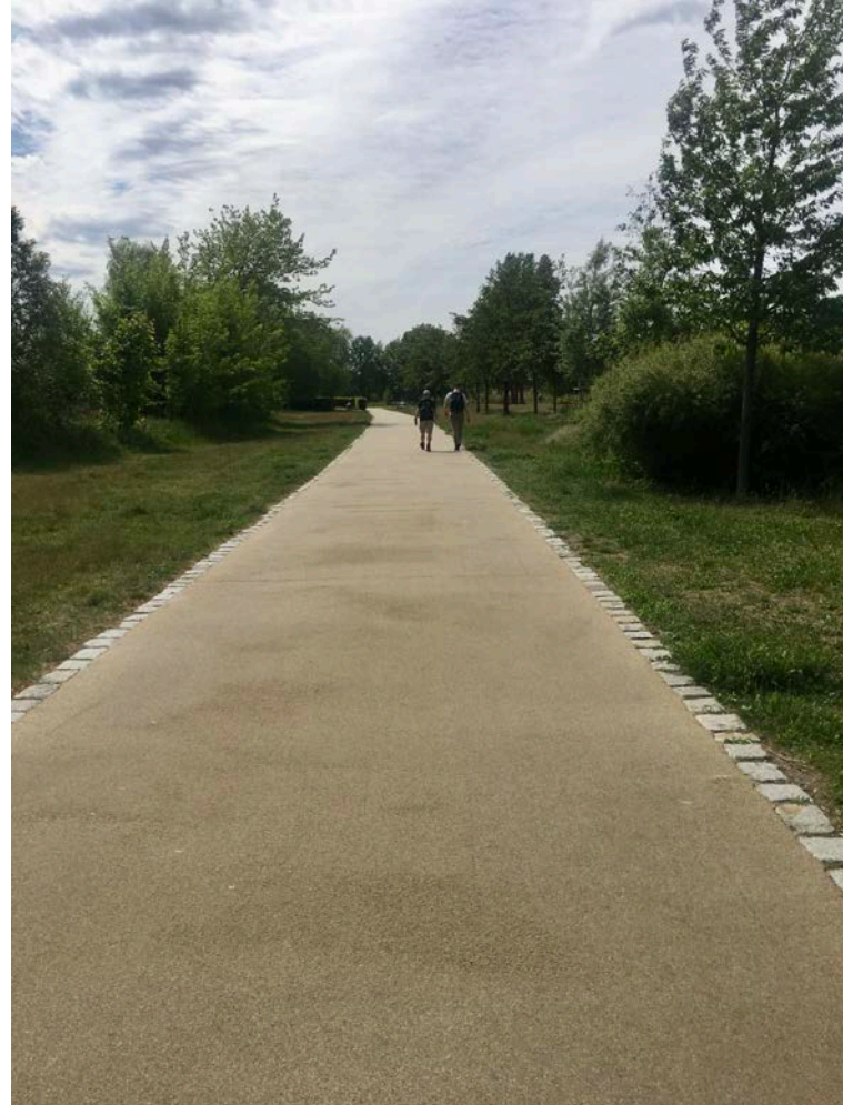
Geh- und Radwegeverbindung Berlin-Spandau