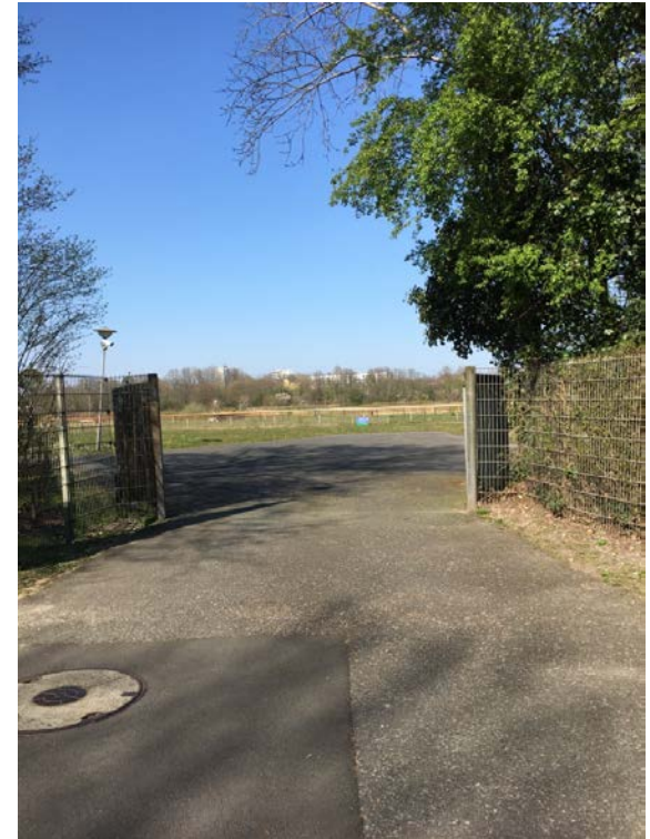
Möglicher Eingang Rennbahngelände