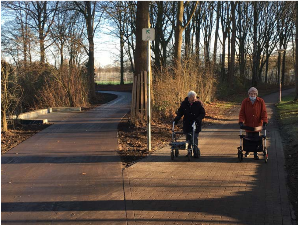
Neue Wegeverbindung Blockdieksee, Osterholz